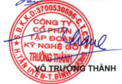
VỖ TRƯỜNG THÀNH