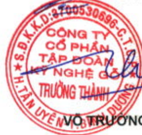
VÕ TRƯƠNG THÀNH