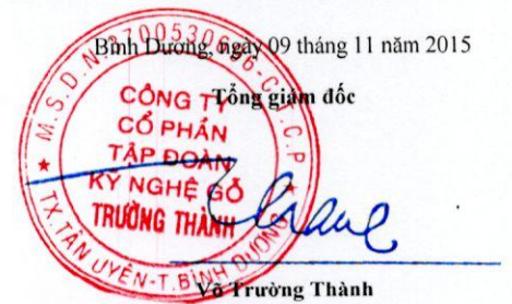
Vũ Trường Thành